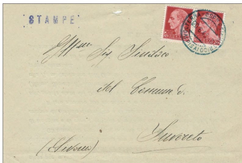
Volterra 20 giugno 1945. Stampa diretta a Suvereto affrancata per 40 centesimi, con due francobolli da 20 centesimi appartenenti all'emissione detta “Imperiale”, annullati con il bollo tipo Guller: “Volterra – Osp.le Psichiatrico (Pisa)”.

Recentemente in un mercatino ho visto in un album di documenti questa stampa che dopo un breve esame ha attirato la mia attenzione, anche se questo non è un periodo che colleziono. Questa stampa affrancata per 40 centesimi reca come annullatore il Guller “Volterra - Osp.le Psichiatrico (Pisa)”. Impresso con inchiostro azzurro questo bollo doveva essere in dotazione a un piccolo ufficio postale o collettorio operante all’interno dell’ospedale psichiatrico.