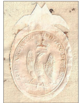
Fig.13 Lettera da Siena del 1813 con uno splendido sigillo. (Coll. Aspot)