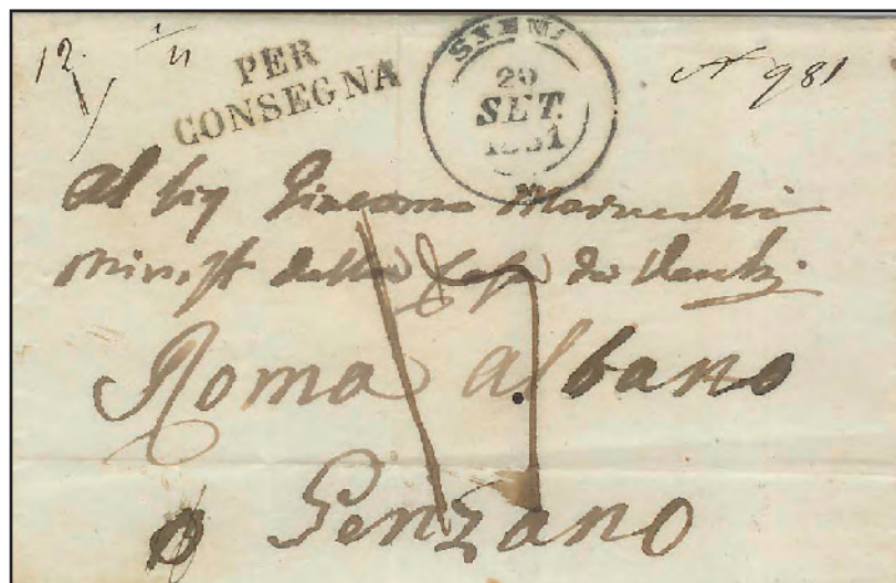
Fig. 2) Lettera da Siena per Genzano, via Roma, del 20 settembre 1851 spedita "per consegna" (con il n° di registrazione 981) in porto pagato fino al confine con lo Stato Pontificio. In base al tariffario vigente, tale lettera costò al mittente 12 crazie, ovvero 1 lira (cifre 1 e 12 riportate nell'angolo in alto a sinistra), dovute per il diritto fisso di raccomandazione (8 crazie), e in quanto lettera di 2° porto del peso di 6 denari (4 crazie), peso deducibile dalla frazione annotata sempre in alto (1/4 d'oncia). Da notare l'abbinamento infrequente tra il "per consegna" ed il bollo a doppio cerchio con crocetta di origine prefilatelica (Aspot n° 16), usato esclusivamente nel biennio 1851-52 su lettere "a contanti", cioè che dovevano essere francate obbligatoriamente dal mittente al momento della loro consegna al servizio postale. La cifra 17 manoscritta al centro, si riferisce alla tassa pontifica ed è espressa in baiocchi.